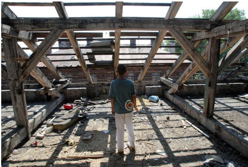
Obrázek 7: Oldřich Roztočil s nájemníky