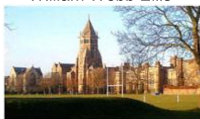
Collège de Rugby

Les origines du rugby sont sans doute plus lointaines.