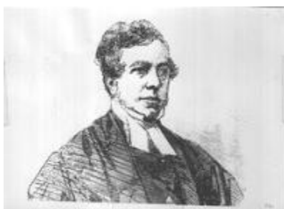
William Webb Ellis

La légende veut que le Rugby ait pris naissance au Collège de Rugby (Angleterre), ce jour de Novembre 1823 où un élève du nom de William Webb Ellis se mit à courir avec le ballon dans ses bras, au cours d'une partie de Football.