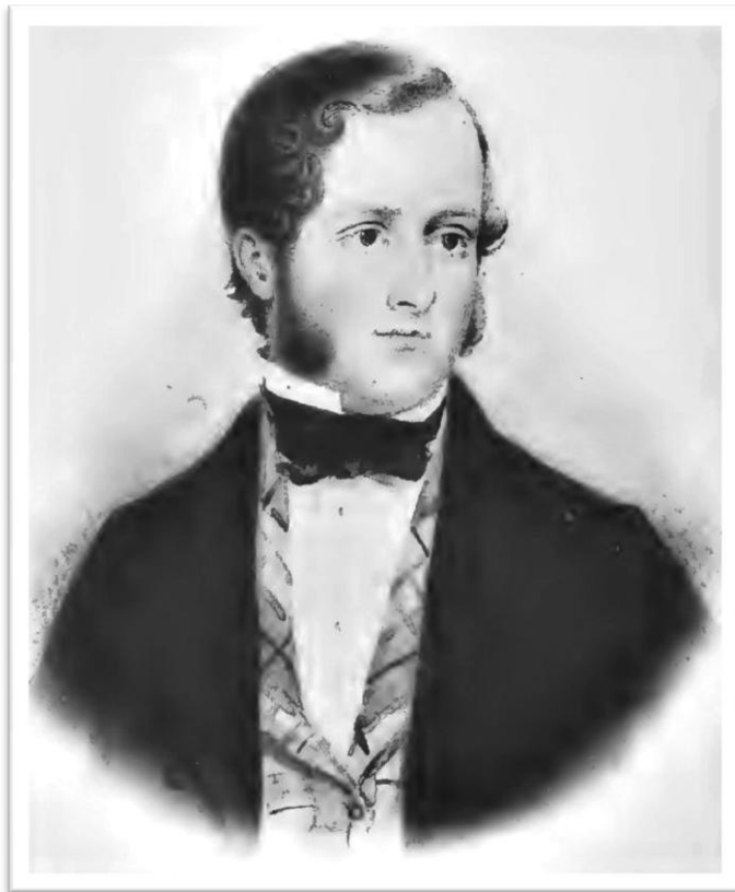
Obrázek č. 1 – Mladý Edward Augustus Freeman