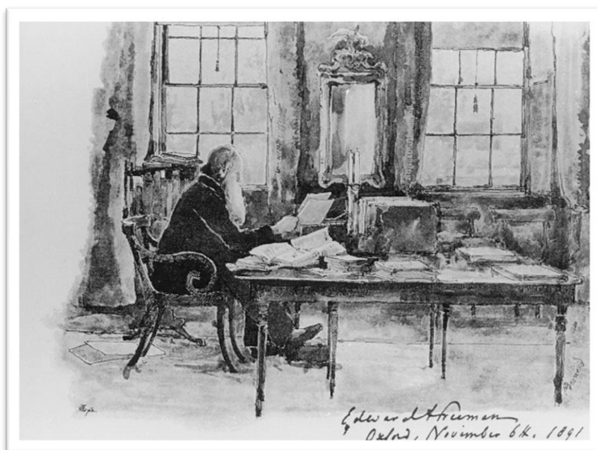
Obrázek č. 3 – Edward Augustus Freeman ve studovně v Oxfordu, listopad 1891