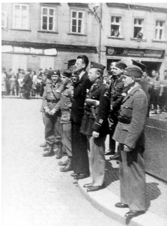
Obrázek č. 2: Američané na Goethově náměstí 223