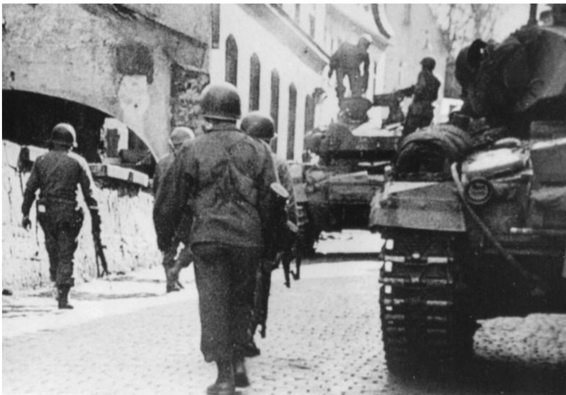
Obrázek č. 4: Američané v Aši 225