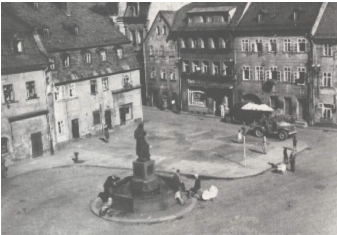
Obrázek č. 1: Goethovo náměstí 222