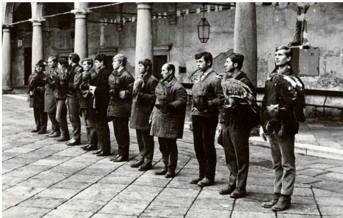
Obrázek 1- Nástup sokolníků na zámku v Opočně 1969.