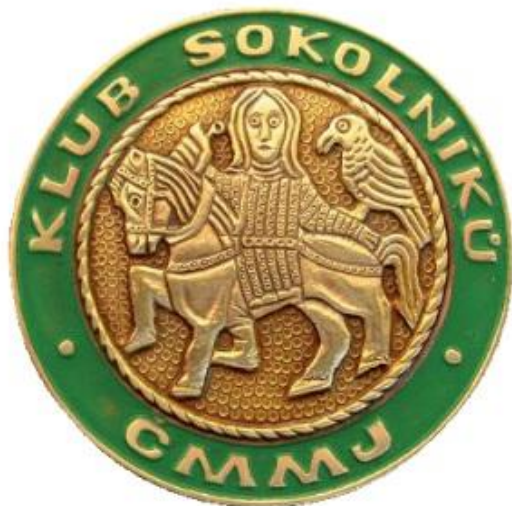
Obrázek 1- Znak klubu sokolníků