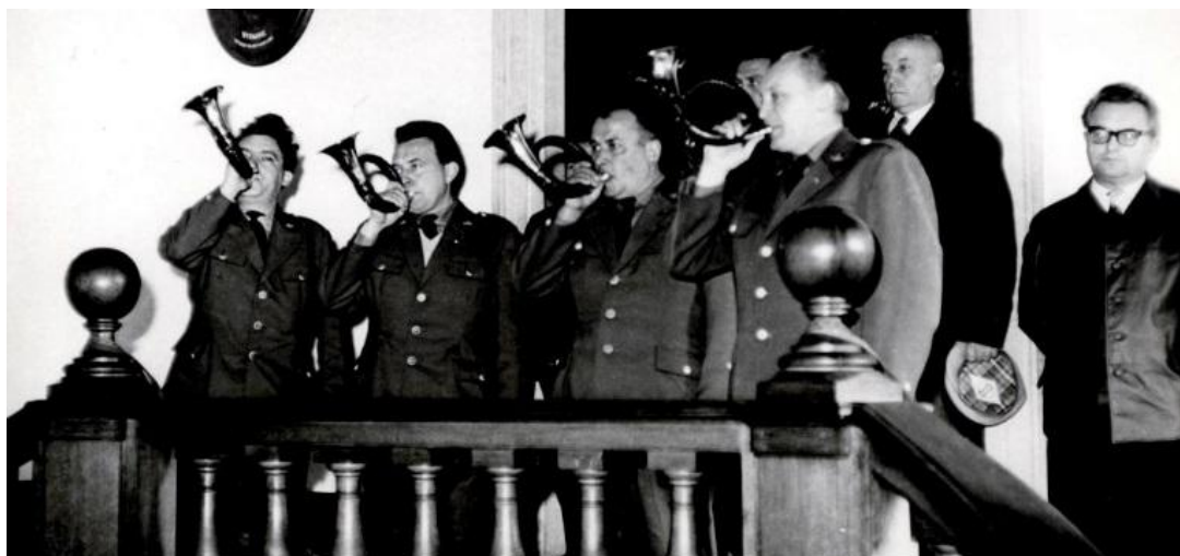
Obrázek 2- Zahajovací konference Klubu sokolníků.