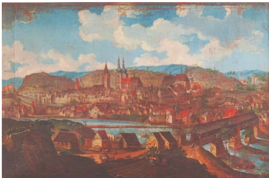
Obrázek 1 Pohled na Kadaň od jihu , první polovina 18. století

Historický atlas měst České republiky ,svazek č.23 – Kadaň: mapový list č.35