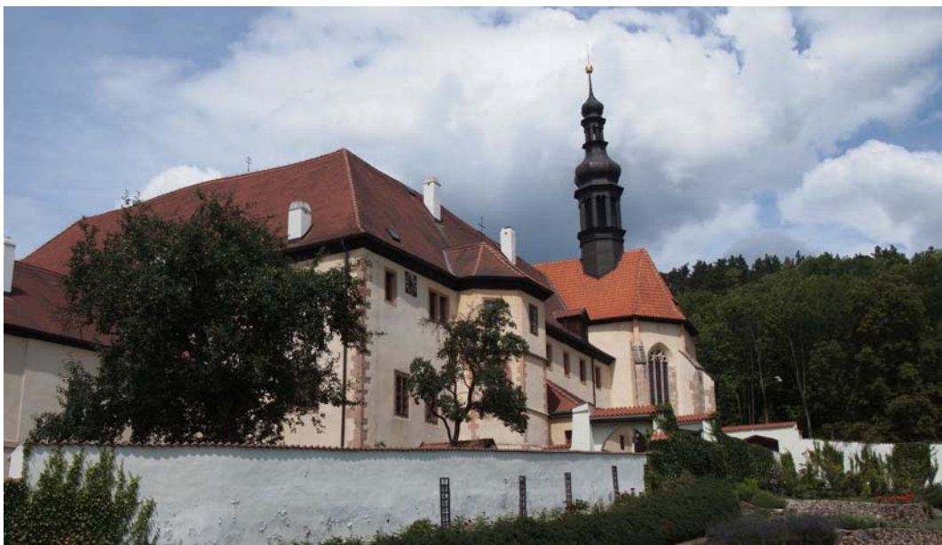
Obrázek 13 Františkánský klášter