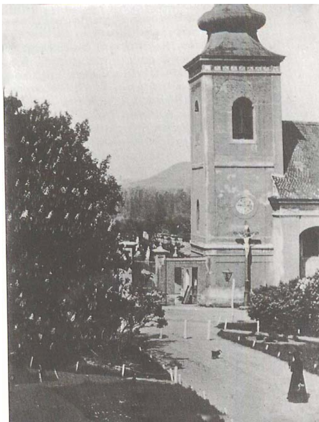
Obrázek 5 Kostel sv. Anny (dnes pravoslavný chrám narození přesv. Bohorodiče), před rokem 1892

Historický atlas měst České republiky ,svazek č.23 – Kadaň: obrázek č. 15