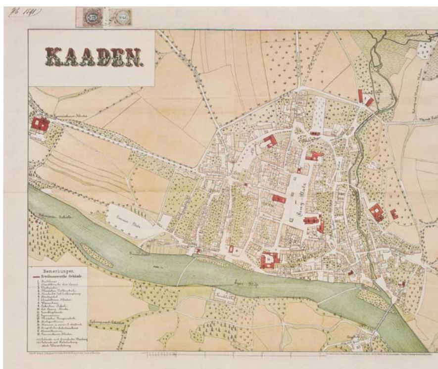
Obrázek 2 Plán města Kadaně z roku 1879

Historický atlas měst České republiky ,svazek č.23 – Kadaň: mapový list č.35