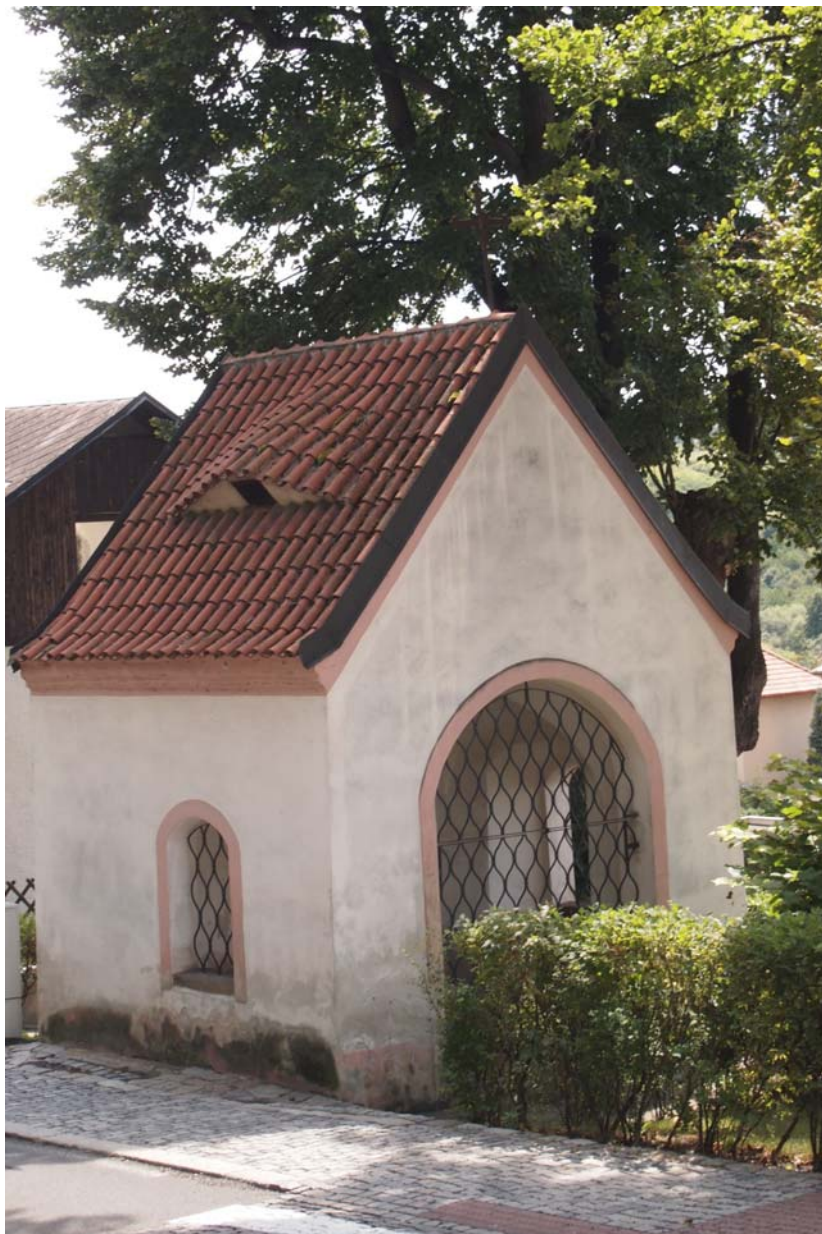
Obrázek 19 Kaple sv. Jana Křtitele