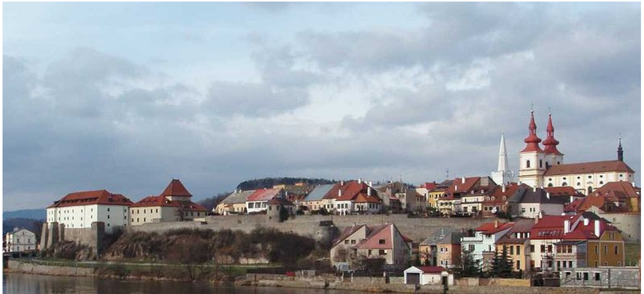
Obrázek 23 současná podoba města Kadaň

Pramen : Příspěvatelé Wikipedie, Kadaň [online], Wikipedie: Otevřená encyklopedie, c2013, Datum poslední revize 25. 03. 2013, 18:21 UTC, [citováno 15. 04. 2013]