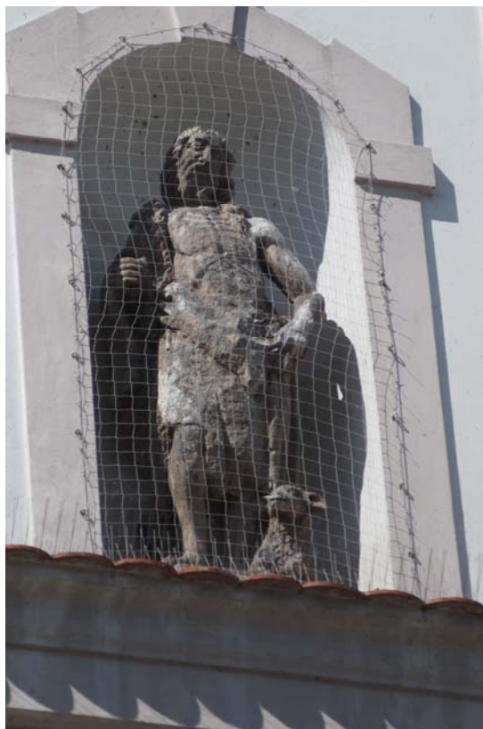
Obrázek 16 Socha sv. Jana Křtitele