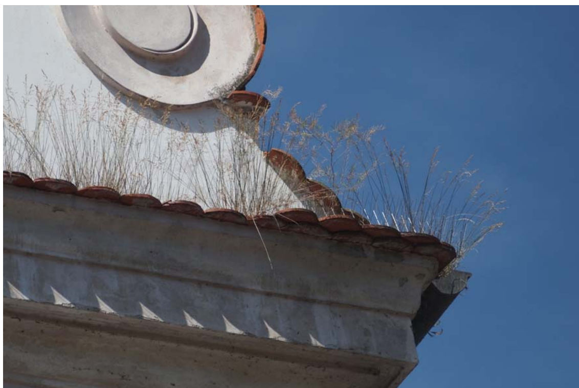
Obrázek 17 Současný stav, kostel Stějí sv. Jana Křtitele