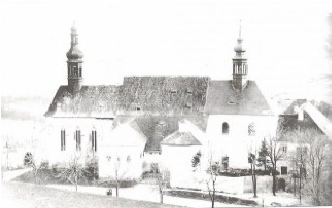
Obrázek 12 Pohled na františkánský klášter ze Svatého vrchu, přelom 19. a 20. století Historický atlas měst České republiky, svazek č.23 – Kadaň: obrázek č. 14