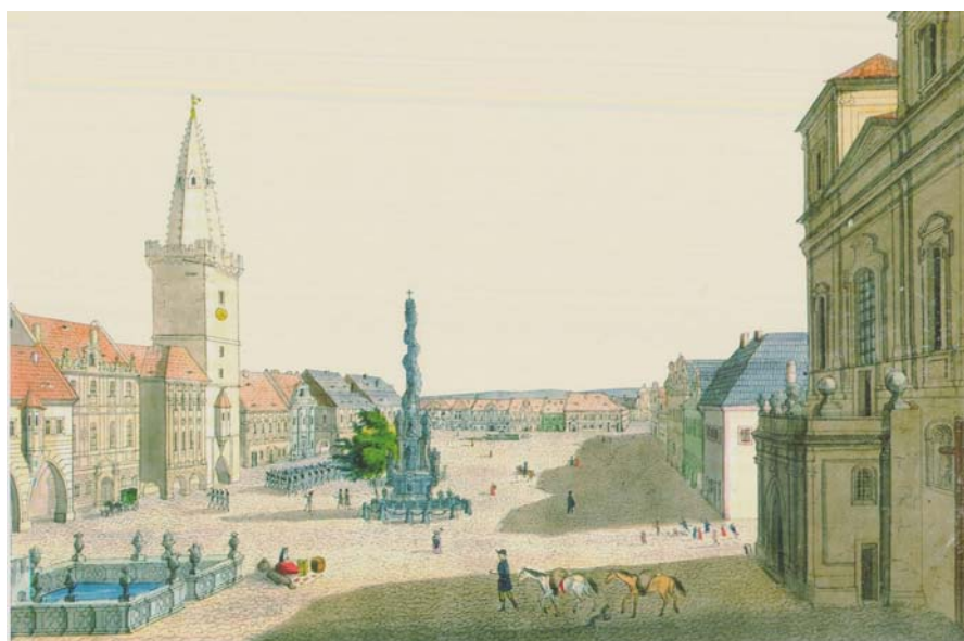
Obrázek 4 Náměstí v Kadani, z roku 1838

Historický atlas měst České republiky ,svazek č.23 – Kadaň: mapový list č. 38