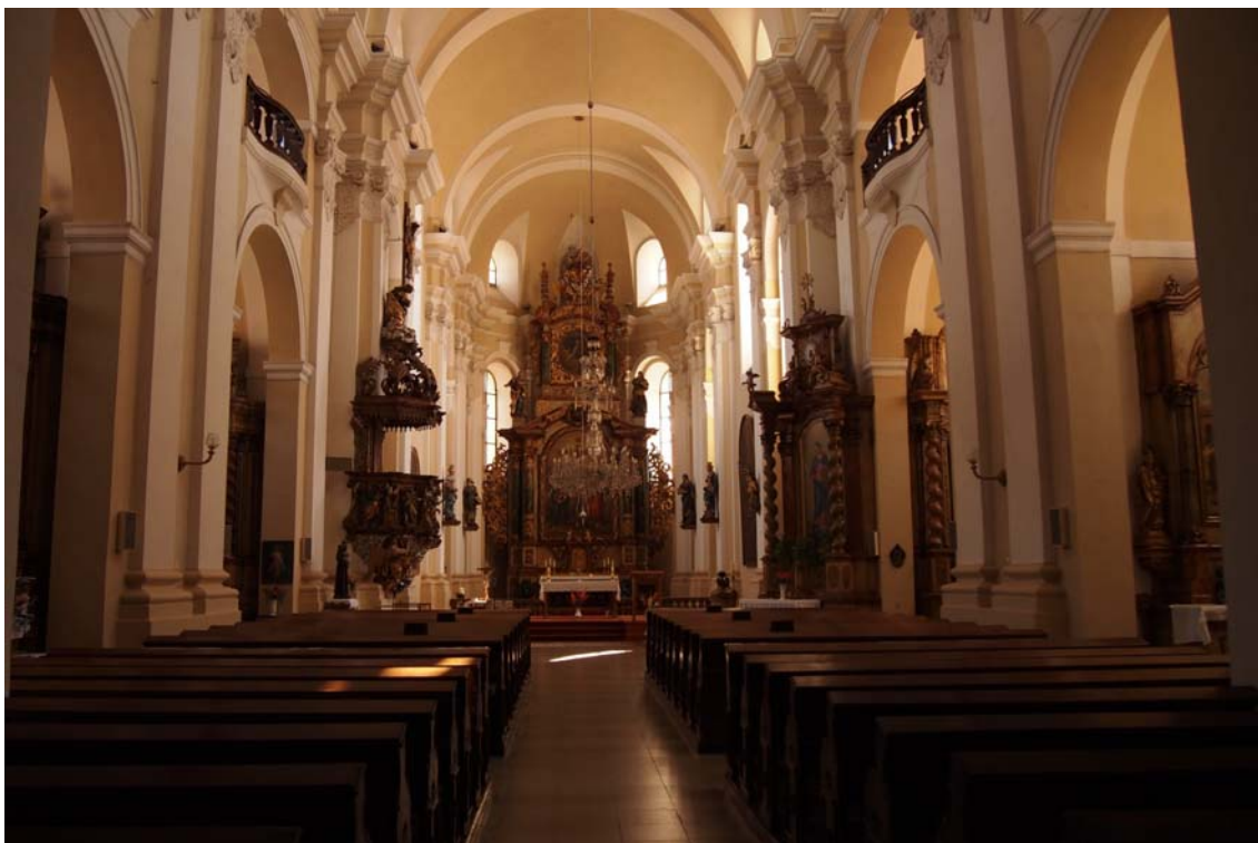
Obrázek 11 Interiér Kostela Povýšení sv. Kříže