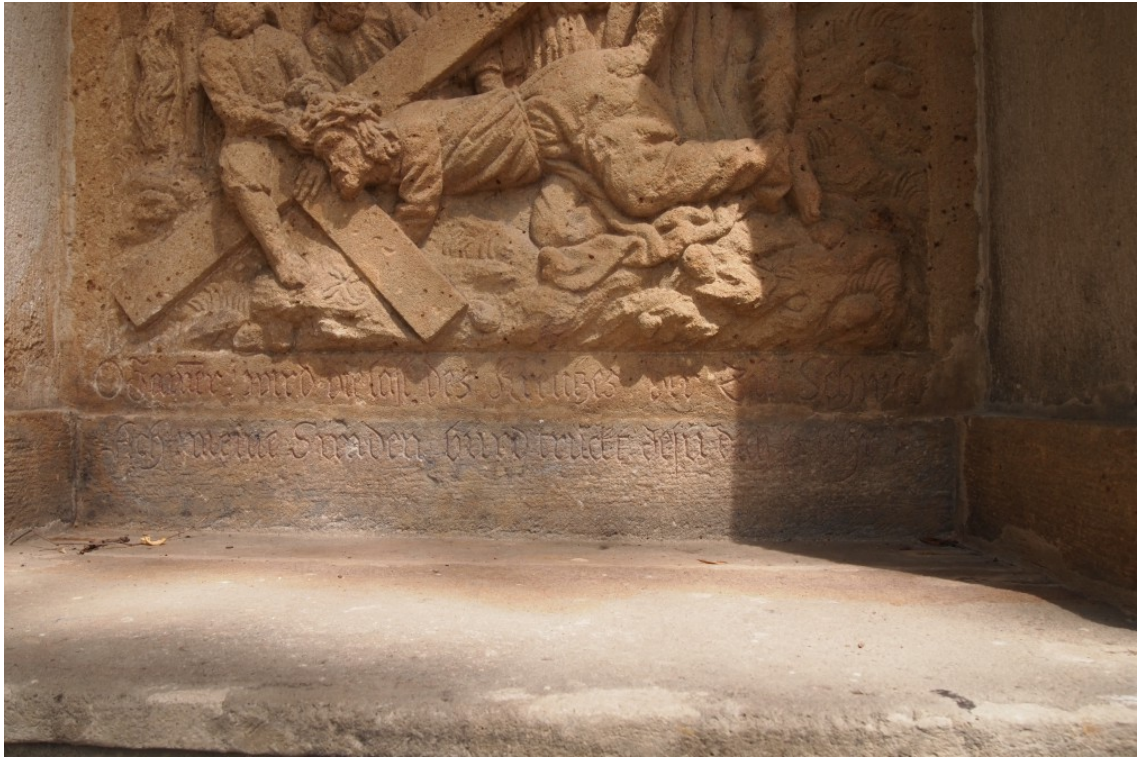
Obrázek 20 Křížová cesta k Františkánskému klášteru, první zastavení, detail německého nápisu znázorňující legendu O Čtrnácti svatých pomocnicích