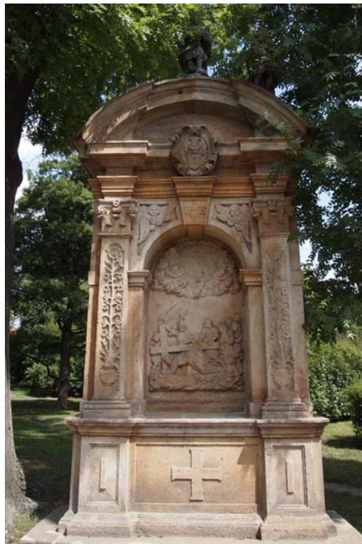
Obrázek 21 Křížová cesta k Františkánskému klášteru, šesté zastavení se sochou svatého Ondřeje na vrcholu