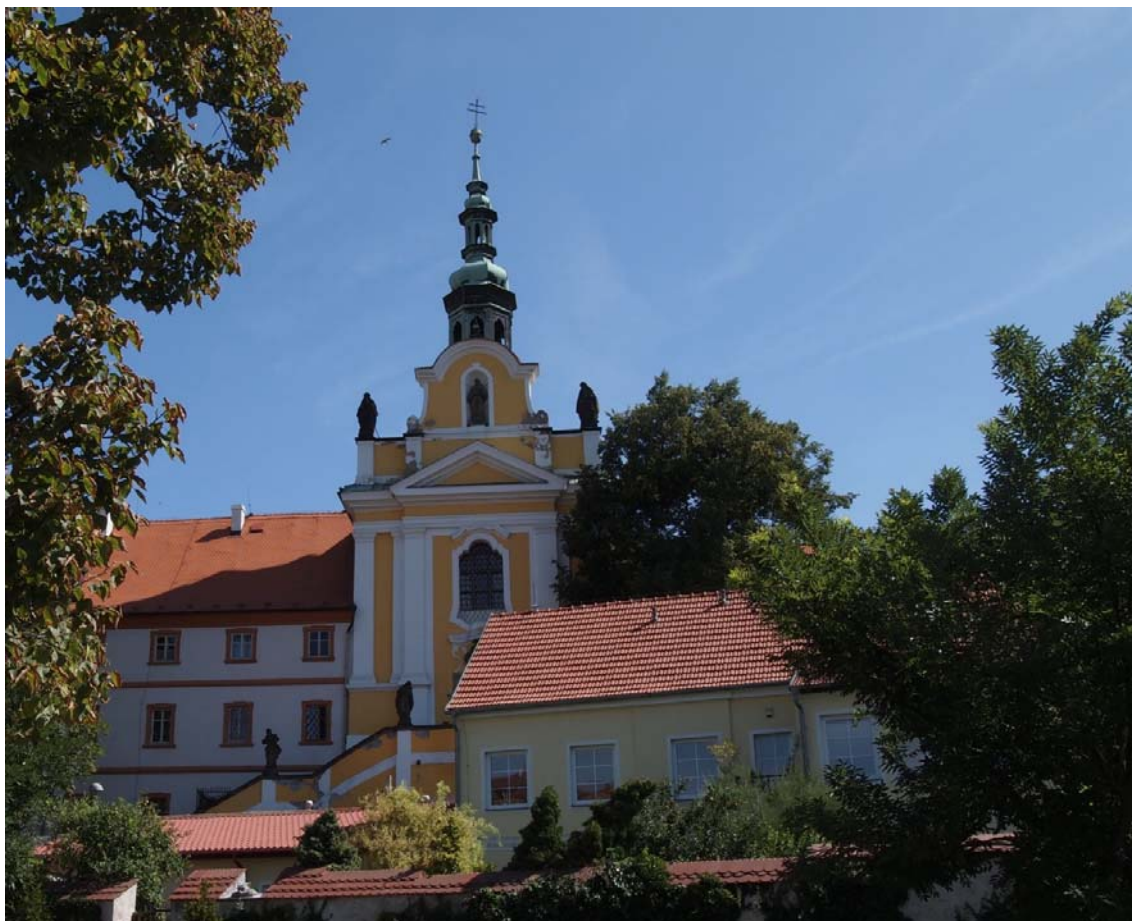
Obrázek 18 Alžbětinský klášter