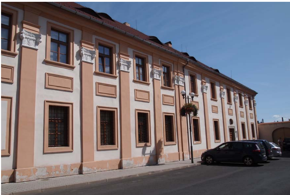
Obrázek 22 Bývalý minoritský klášter, dnes sídlo Státního oblastního archivu Litoměřice se sídlem v Kadani