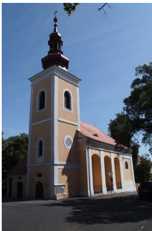
Obrázek 6 Kostel sv. Anny

Historický atlas měst České republiky ,svazek č.23 – Kadaň: obrázek č. 15