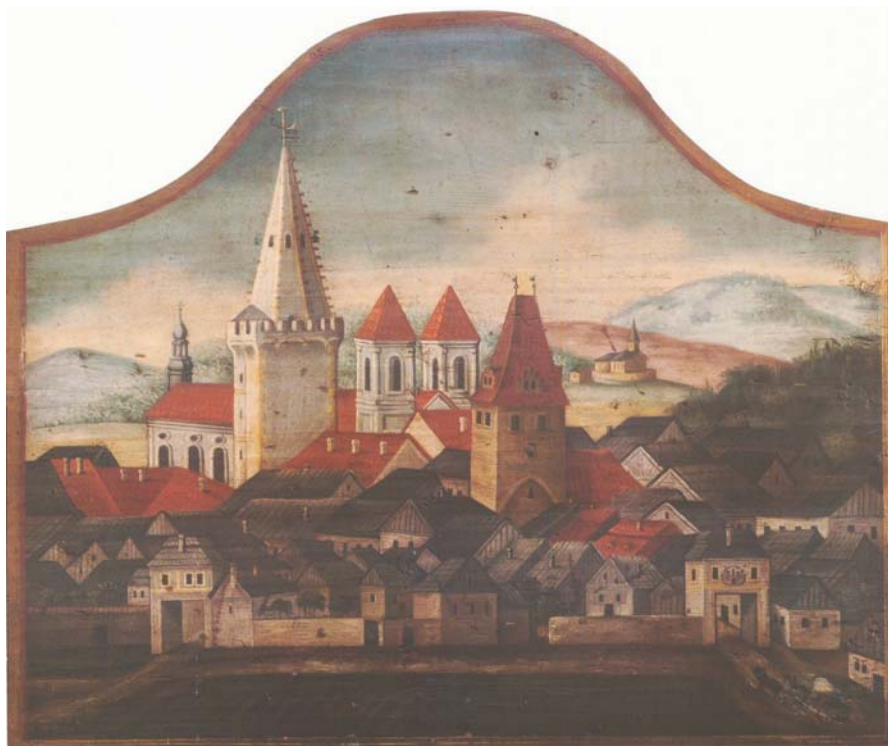
Obrázek 3 Pohled na Kadaň od západu, mezi léty 1813 - 1830

Historický atlas měst České republiky ,svazek č.23 – Kadaň: mapový list č. 38