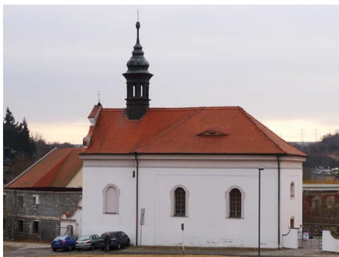
Obrázek 15 Kostel Stětí sv. Jana Křtitele

Historický atlas měst České republiky ,svazek č.23 – Kadaň: obrázek č. 16