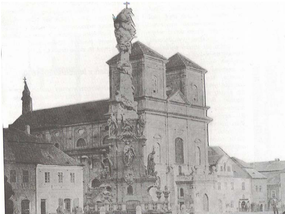
Obrázek 9 Kostel Povýšení sv. Kříže, z roku 1861

Historický atlas měst České republiky ,svazek č.23 – Kadaň: obrázek č. 17