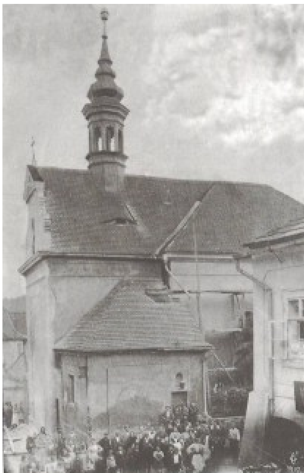
Obrázek 14 Kostel Stětí sv. Jana Křtitele, před rokem 1898

Historický atlas měst České republiky ,svazek č.23 – Kadaň: obrázek č. 16