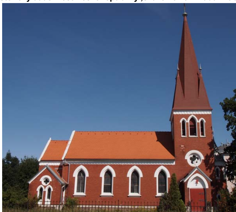
Obrázek 8 Kostel Československé církve husitské

Historický atlas měst České republiky ,svazek č.23 – Kadaň: obrázek č. 25