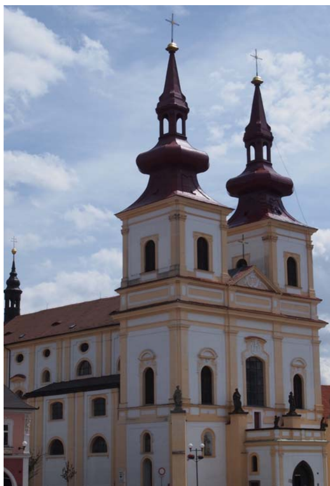
Obrázek 10 Kostel Povýšení sv. Kříže

Historický atlas měst České republiky ,svazek č.23 – Kadaň: obrázek č. 17