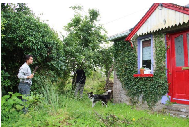
Příloha 21 – Drát zarostlý ve stromech 1