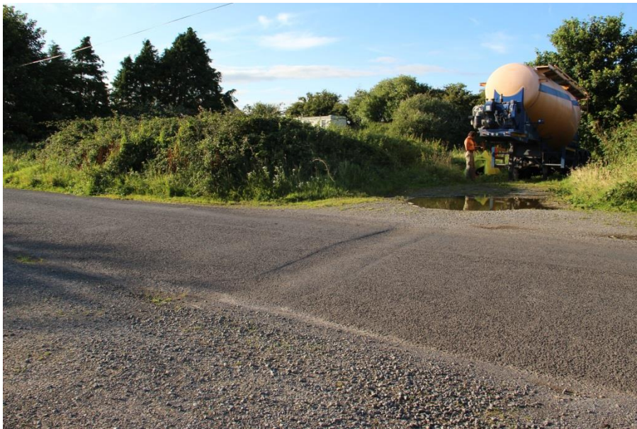
Příloha 36 – Stanování u cisterny 1