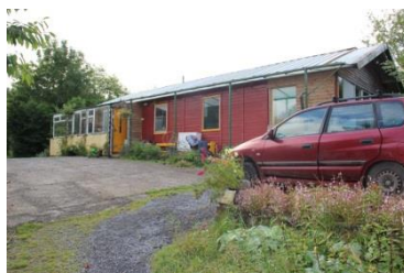
Příloha 5 – „druhá farma“ 2