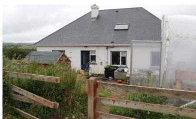
Příloha 4 – „první farma“ 2