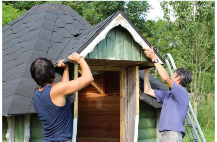
Příloha 30 – Práce na zahradním domku 1