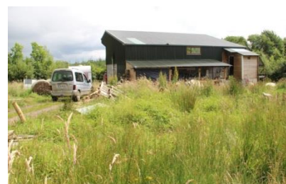
Příloha 6 – Ateliér Holandana 2