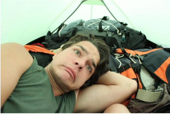
Příloha 23 – Zoufalství ve stanu 1