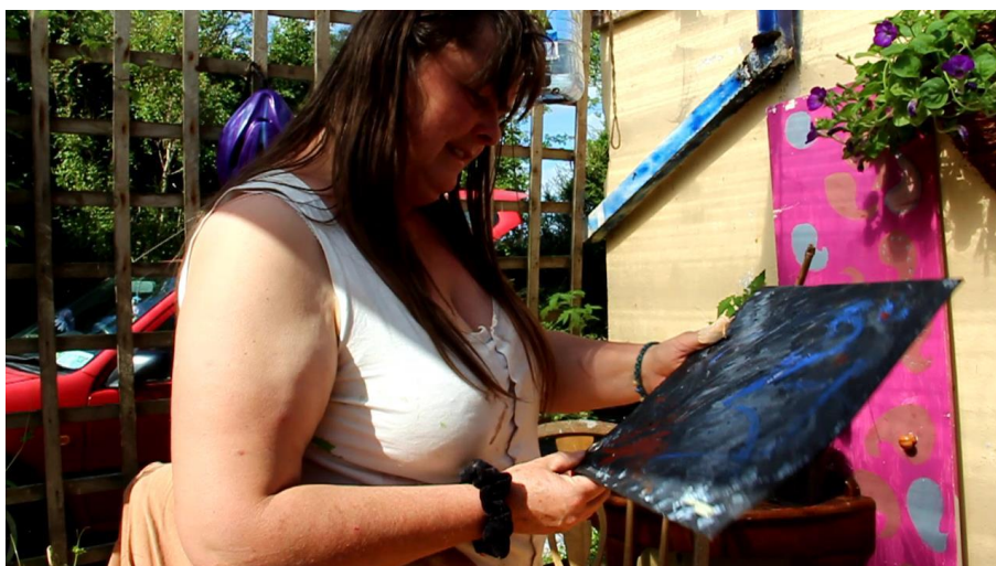
Příloha 22 – Aisling umělkyně 1