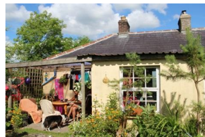
Příloha 3 – Dům Aisling 2