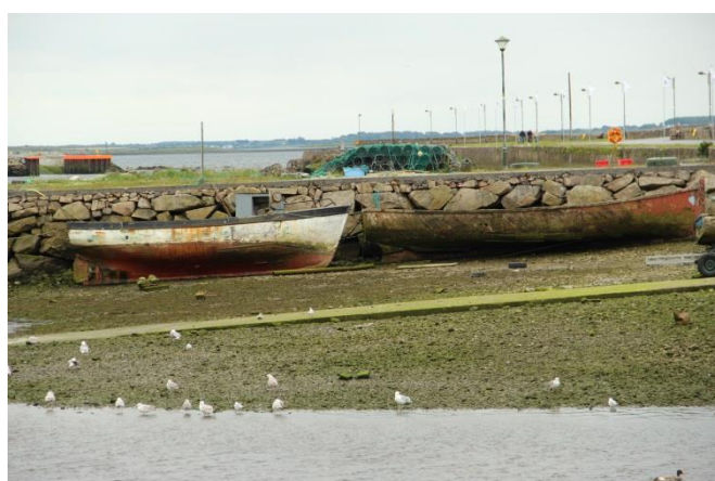
Příloha 17 – Přístav 1