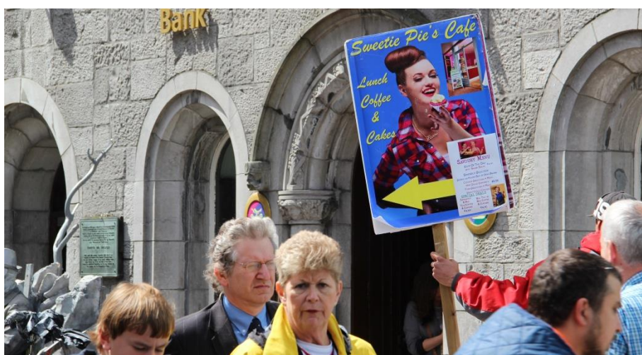
Příloha 15 – Galway, Shop street 1