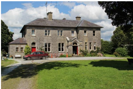
Příloha 18 – Buddhistické centrum 1