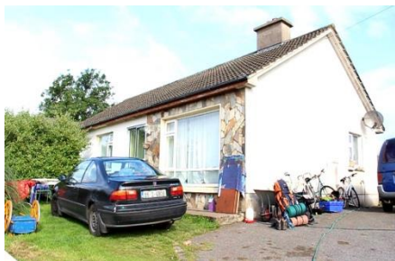
Příloha č. 1 – Greenway farm 2