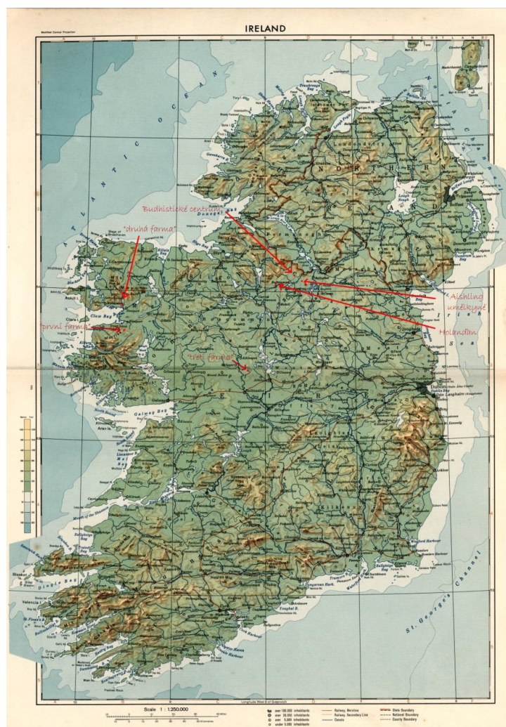
Příloha 7 – Mapa Irska z roku 1956 1