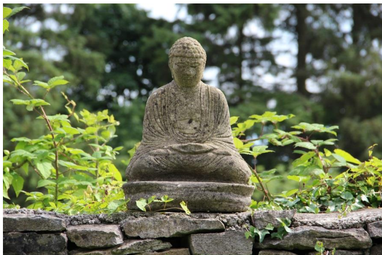
Příloha 19 – Buddha socha 1