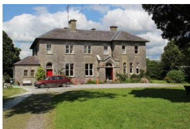
Příloha 2 – Buddhistické centrum 2