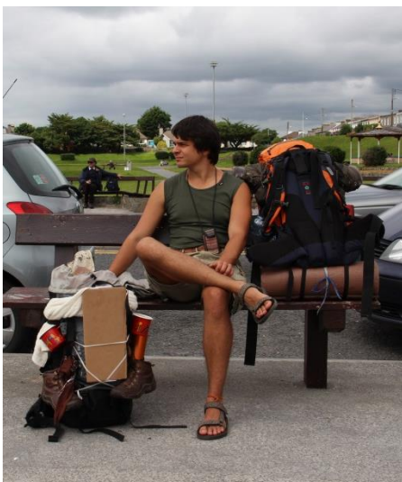
Příloha 27 – Odpočinek 1