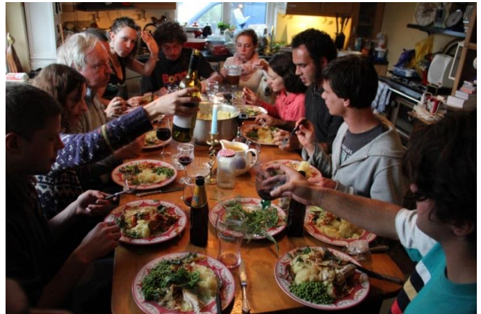
Příloha 25 – Večeře v Greenway farm 1

Dates WWOOFers required: March to October.