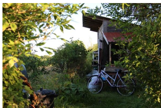
Příloha 20 – Zahradní domek 1