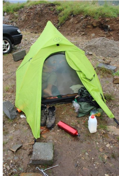
Příloha 24 – Stan 1