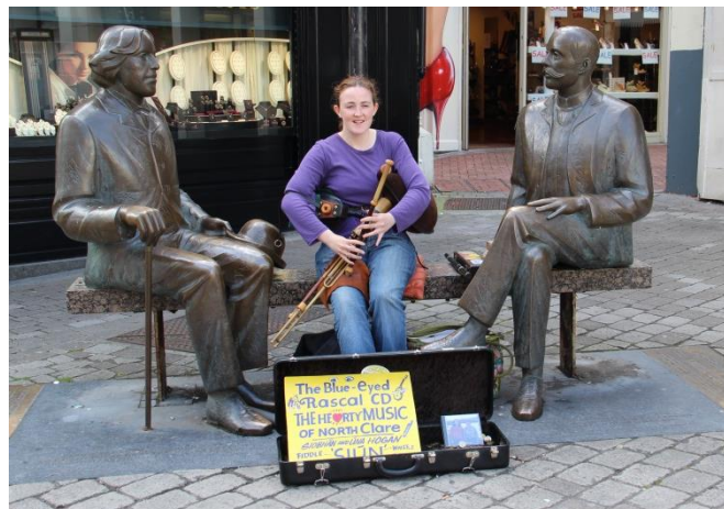
Příloha 14 – Galway, Oscar Wilde 1