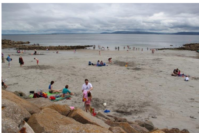
Příloha 16 – Galway pláž 1