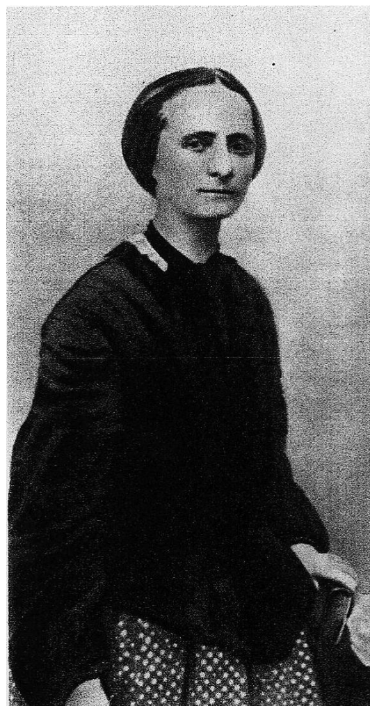
Příloha č. 5: Poslední fotografie B. Němcové. Rzounek, Vítězslav. Božena Němcová v obrazech a v dokumentech, 1951.