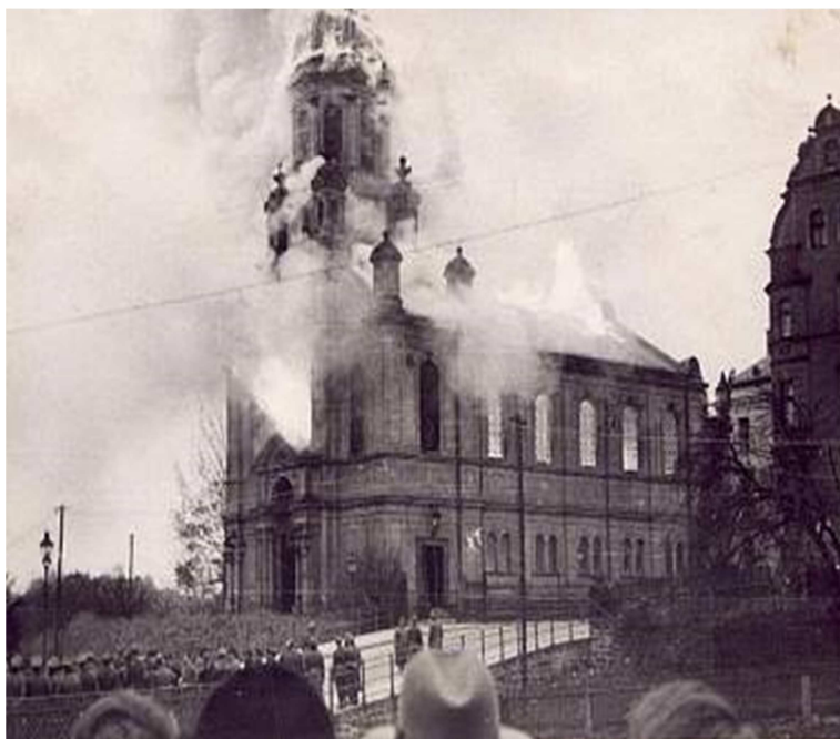
Vypálení liberecké synagogy za tzv. křišťálové noci. 391