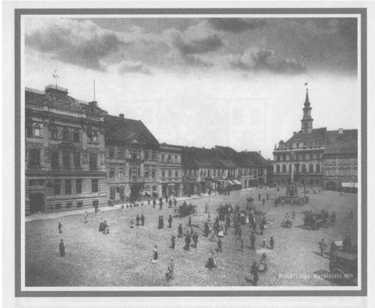
Obr. č. 2 Česká Lípa – náměstí rok 1894 (Panáček, Smejkal, Vojtíšková, 1999, str. 123)

V České Lípě bylo neustále potlačováno přirozené jazykové právo, a proto se obyvatelé snažili o založení spolku. Podařilo se jim založit Českou besedu, později Sokol, ale byli vystaveni takové perzekuci, že bylo vše na třináct let zrušeno. Nepodařilo se prosadit ani zřízení české školy, i když české děti byly v německých školách diskriminovány a tudíž se česky učit nesměly. 104