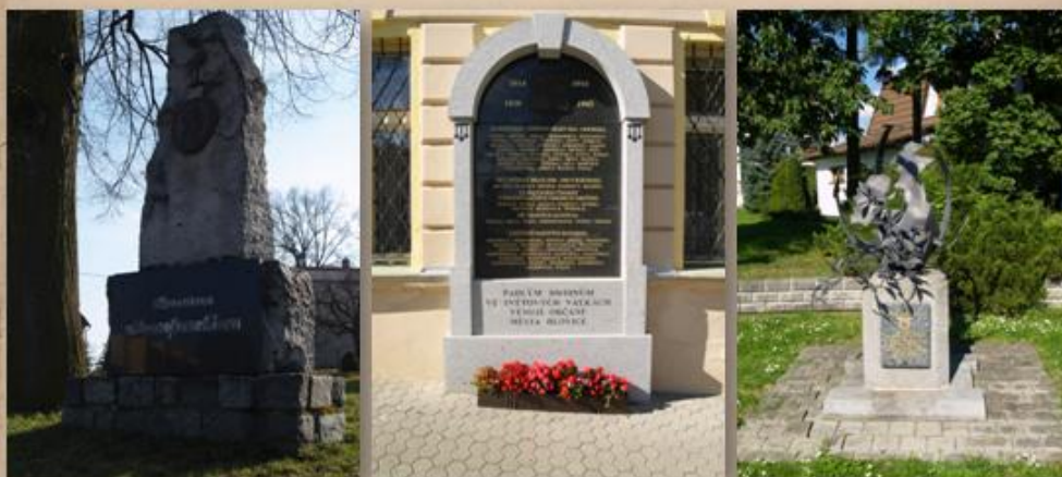
Pomník mistra Jana Husa