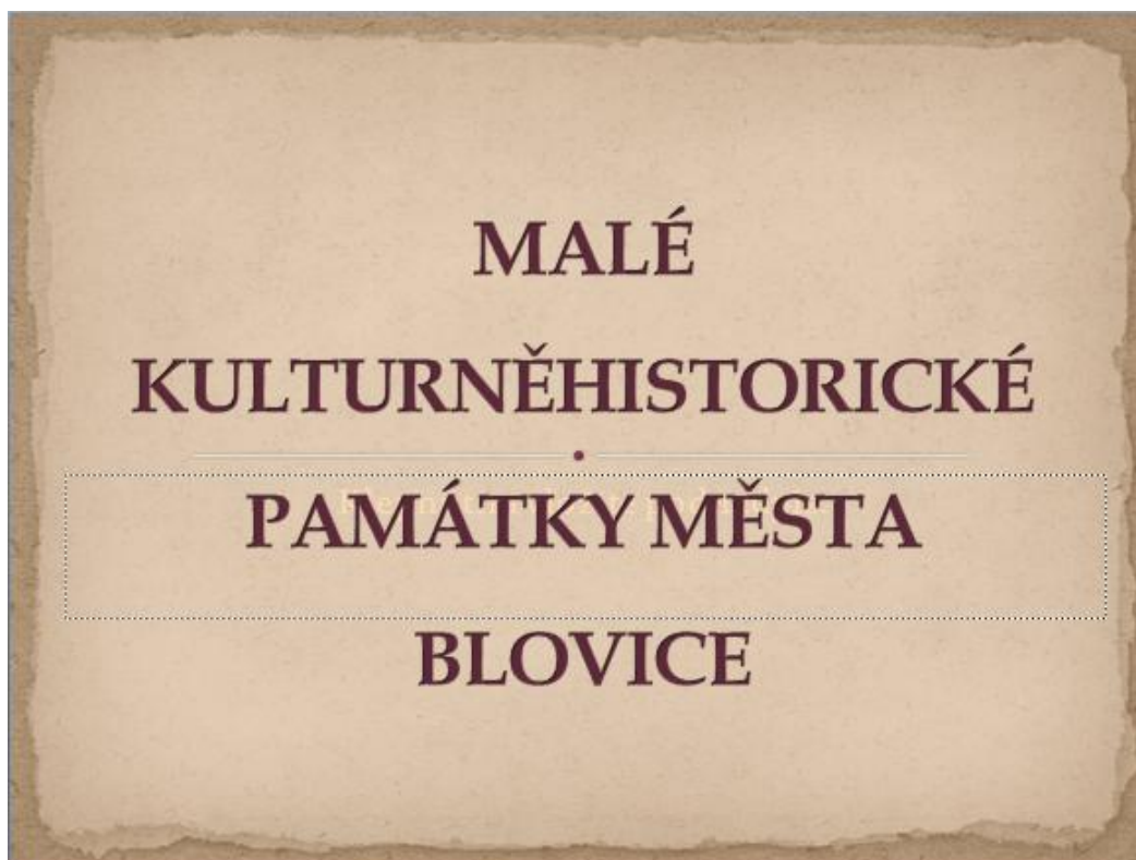
Snímek č. 1