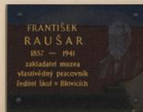
Snímek č. 4