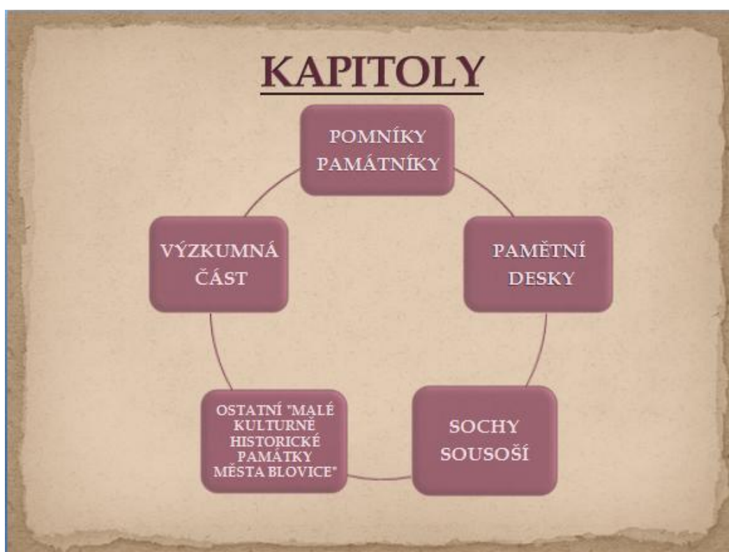
Snímek č. 2