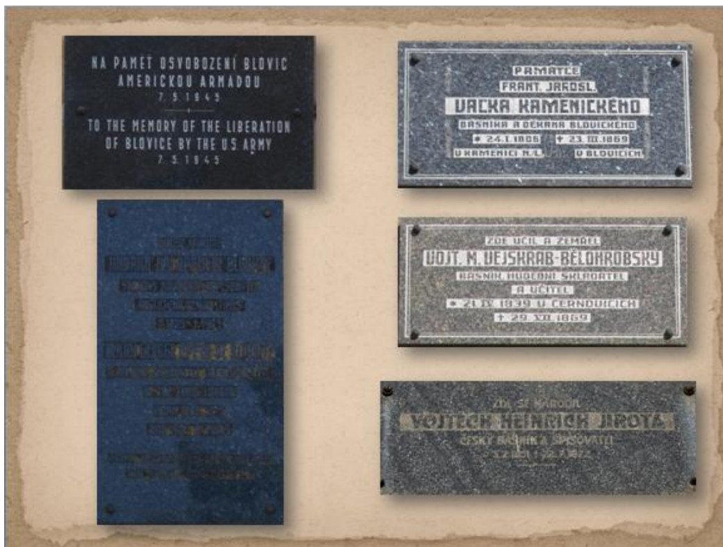
Snímek č. 5