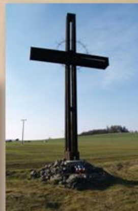
Snímek č. 7