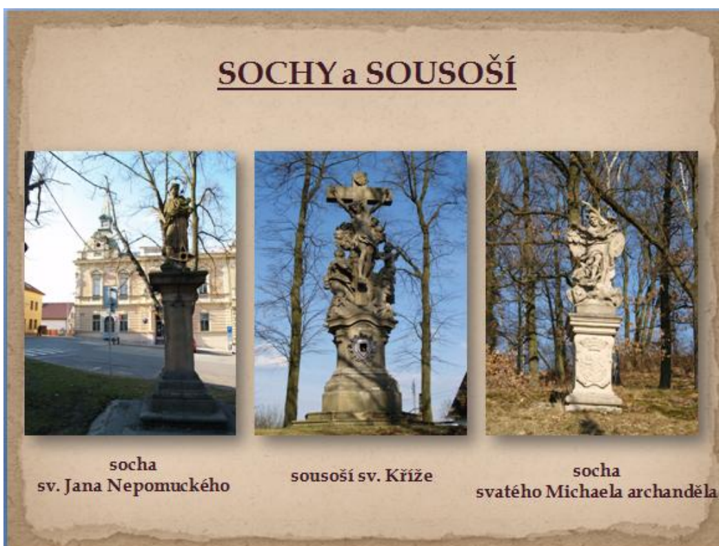
Snímek č. 6